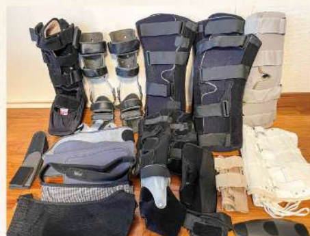
これまでダラムサラに届けられたサポーターなどの装具