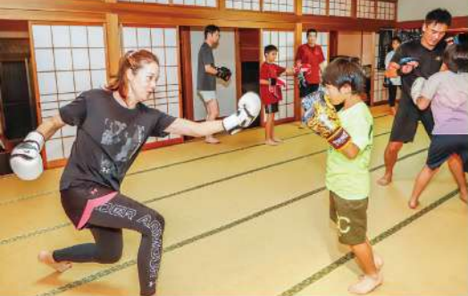
のトレーニングメニューで1時間熱中