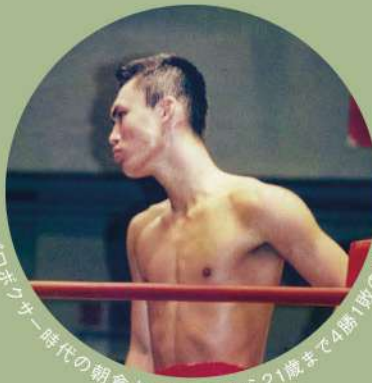
プロボクサー時代の朝倉さんは19歳から21歳まで4勝1敗の戦績