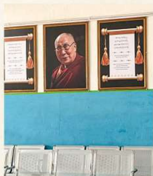
ダラムサラ市内の各所に掲げられたダライ・ラマ14世の肖像写真