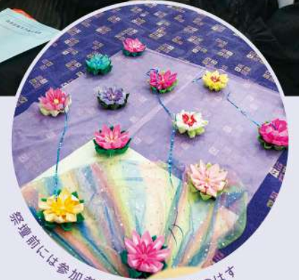
祭壇前には参加者が持参した折り紙のはず