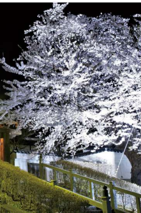
夜桜のライトアップ