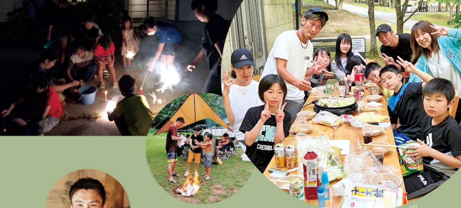
教室の仲間とその家族も集まって夏まつり