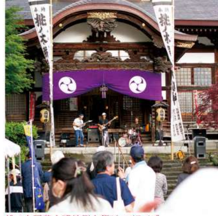
桃ノ木稲荷大明神例大祭ジャズライブ