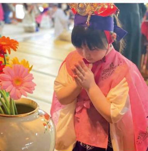
花まつり・華やかな稚児衣装の子もたち