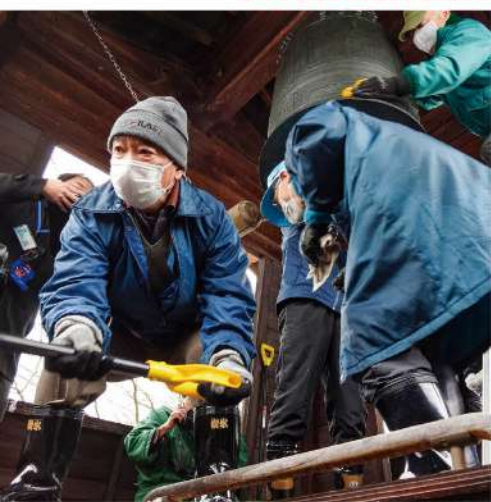
除夜の鐘に備えて地域の方々が大掃除