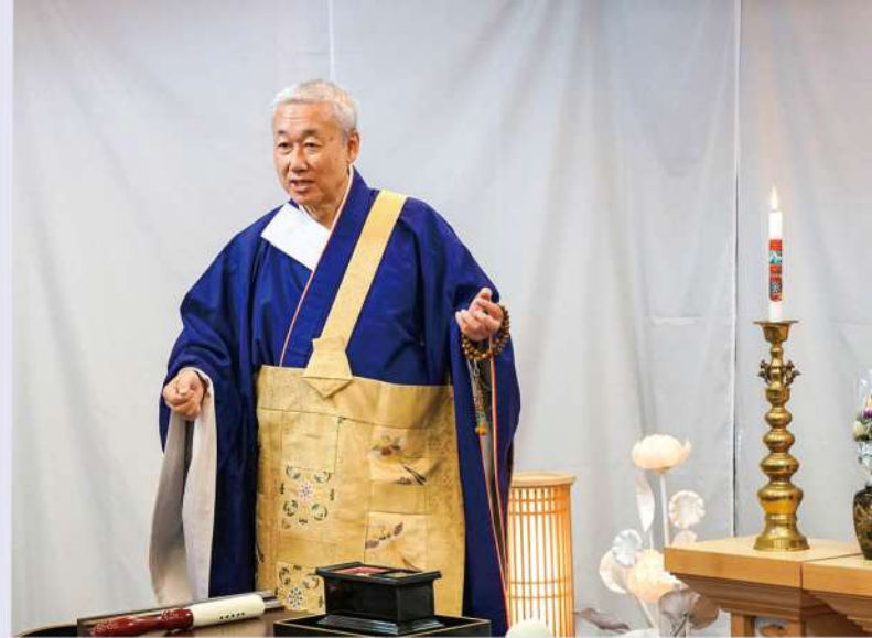
お葬式をもっと身近に感じてもらえる機会になったと語る稲岡住職