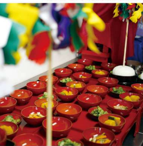
全ての仏さまを供養する施食会