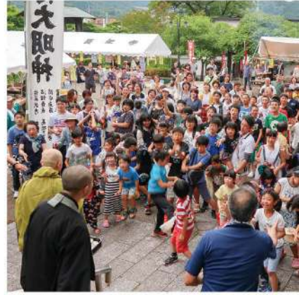
餅まき・じえんこ(お金)まき