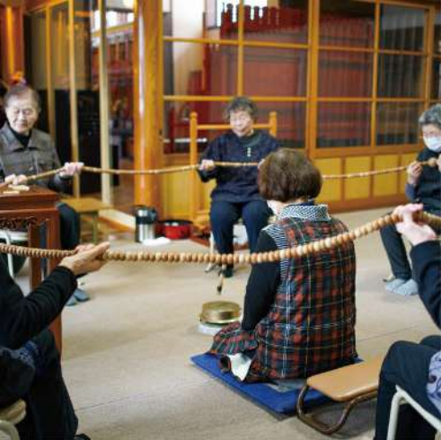
無病息災を祈る百万遍念仏