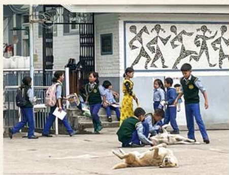
ダラムサラの子ども村。全寮制の学校で、母国では禁止されているチベット語の授業・仏教を学ぶ子どもたち

木山 医療環境も厳しく、リハビリ用装具は全く足りない状況だとうかがいました。さて、どうやって集めようかと迷っていた時、再び秋田での骨折（笑）……昨年のことです。